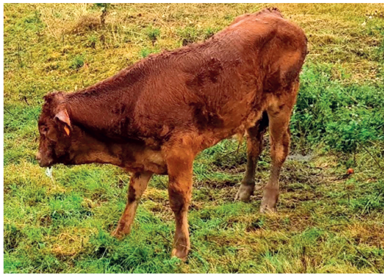
Figure 5 : Les IPI sont de véritables bombes à virus ! Eliminer ces animaux le plus rapidement possible est indispensable afin d'assainir un cheptel rapidement.

93 cheptels devant mettre en place cette surveillance suite à résultat sérologique défavorable n'ont pour l'instant pas donné suite. Dès lors que les résultats de prophylaxie et l'enquête épidémiologique sont défavorables, il convient de mettre en place une surveillance par boucle d'identification TST. La réussite de l'éradication de la BVD passe par l'implication collective de tous les éleveurs. Il est donc indispensable que les éleveurs concernés mettent en place cette surveillance dans les meilleurs délais dès la connaissance d'un résultat défavorable.