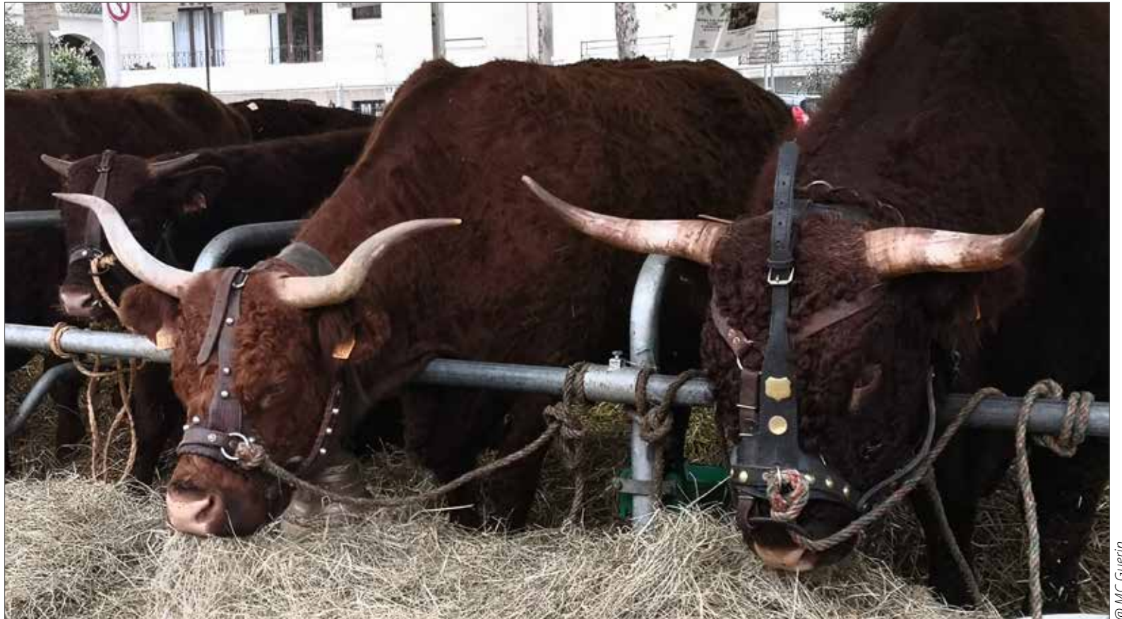
National salers 2022

- 8 jours minimum avant : l'organisateur adresse les certificats sanitaires complétés à la DDETSPP19 et au GCDS. Le certificat bovin doit préciser en plus des noms et coordonnées des détenteurs désirant exposer, l'identification individuelle des animaux. Le certificat autres espèces (ovins-caprins-porcins) doit comprendre les coordonnées du détenteur et le nombre d'animaux inscrits.