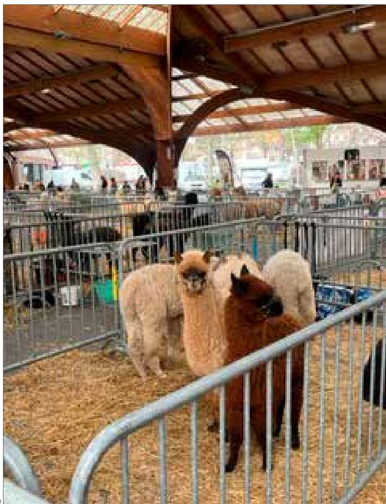
@ MC Guerin

Sans vérification au préalable des certificats, tous les troupeaux ayant participé à un rassemblement non autorisé verront leurs statuts sanitaires suspendus entraînant le blocage de leurs animaux dans l'attente de mesures sanitaires levant un potentiel risque d'infection. Il en est de même pour tous les troupeaux refusés en amont et participants quand même à un rassemblement.