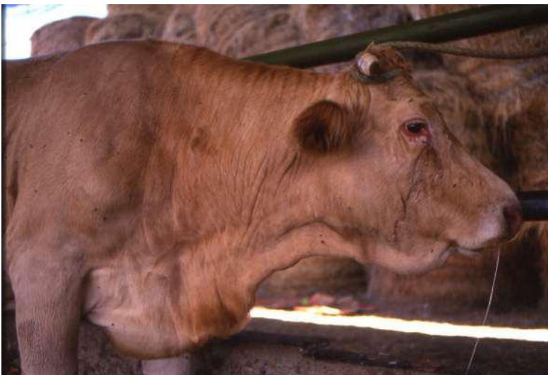
Photo 1: Aux stades précoces de la maladie, l'animal présente de la fièvre et des écoulements oculaires et nasaux.

Cette maladie se manifeste par de la fièvre et des oedèmes de la peau qui s'épaissit et prend un aspect cartonneux avec des escarres et des dépilations ; l'évolution se fait systématiquement vers la mort ou une non valeur économique, les animaux devenant stériles.