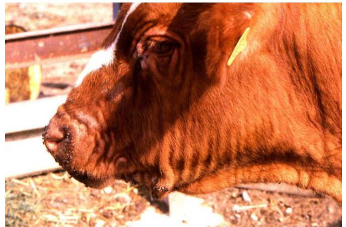
Photo 2 : Au stade de la sclérodémie (peau d'éléphant), seule l'élimination est préconisée

Le portage sain de ce parasite peut persister longtemps (jusqu'à 8 ans) et la maladie peut se déclarer à nouveau à tout moment même en dehors de la période habituelle d'activité des insectes piqueurs.