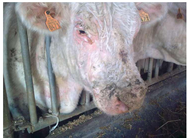
Photo 3 : Isoler les animaux atteints est impératif pour limiter la propagation de cette maladie