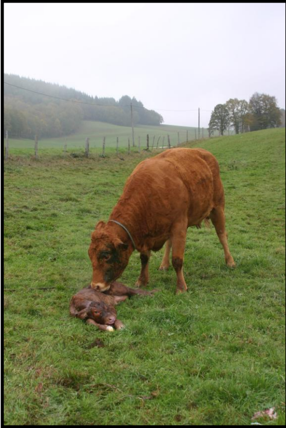
Photo 1 : En cas de diarrhée colibacillaire, c'est le plus souvent en vaccinant la mère que l'on peut sauver le veau.