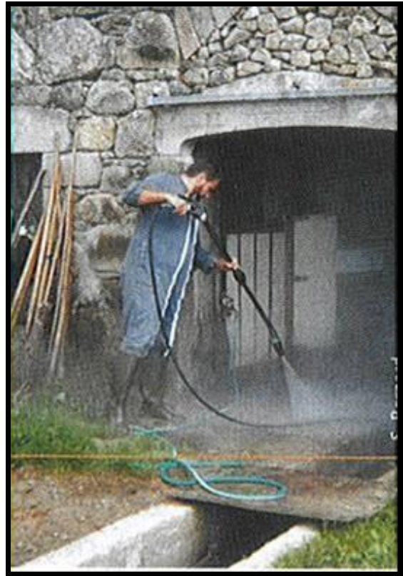
Photo 2 : Un nettoyage et une désinfection soignée des bâtiments sont une solution souvent très efficace pour prévenir les épisodes de diarrhées néonatales