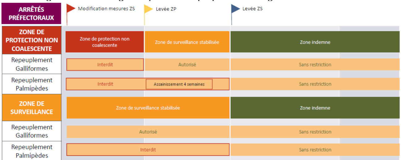
Figure 2 – Chronologie des phases du repeuplement des zones non-coalescentes